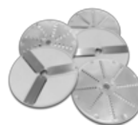
Incluye 5 discos de corte intercambiables