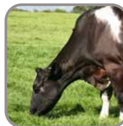
Función de Pesaje de Animales