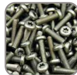
Función de Conteo de Piezas

Distribuido por: Central Distribuidora Ojeda Refrigeración S.A. de C.V.