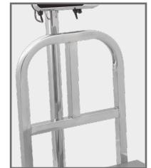
Barandal de carga en BAPAG-200