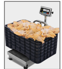
A prueba de agua, útil en cuartos fríos