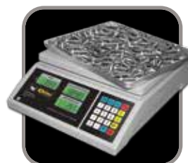
Gire el plato y úselo como charola