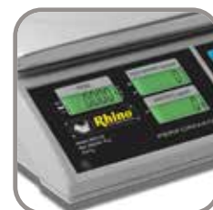
Tres pantallas: Peso Unitario, Peso Total y Número de Piezas