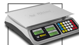
Incluye mica protectora