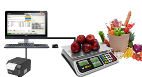
Habilitada con comunicación a PC (RS-232) para operar con soluciones punto de venta