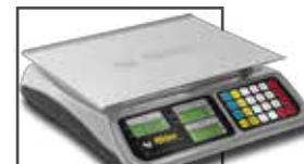
Incluye mica protectora