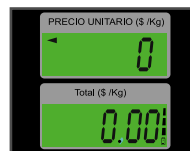
Pantallas de cuarzo con iluminación (backlight)