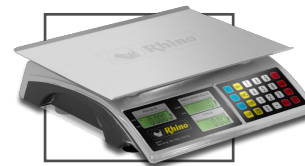
Incluye mica protectora