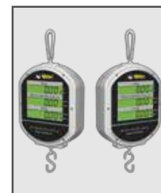
Pantallas para usuario y cliente con iluminación (backlight)