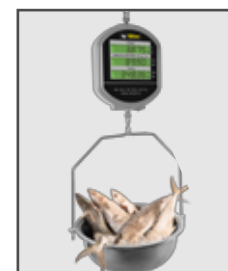
Ideal para verdulerías y recauderías