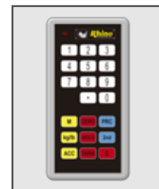
Incluye control remoto de x metros de alcance

Distribuido por: Central Distribuidora Ojeda Refrigeración S.A. de C.V. Contacto: atencionclientes@cdo.com.mx Tel : (0155)2453 8899 | 5670 0771 | 56700761