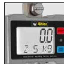
Pantalla de cuarzo líquido con iluminación