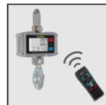
Opción de operación a distancia por control remoto (BAC-500)