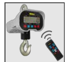
Opción de operación a distancia por control remoto

Distribuido por: Central Distribuidora Ojeda Refrigeración S.A. de C.V. Contacto: atencionaclientes@cdo.com.mx Tel : (0155)2453 8899 | 5670 0771 | 56700761