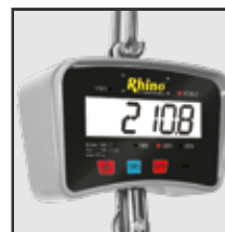
Pantalla de cuarzo líquido con iluminación