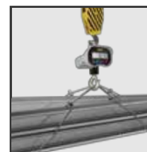
Ideales para la industria, construidas en acero