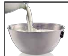
Tazón de acero inoxidable con graduación

Distribuido por: Central Distribuidora Ojeda Refrigeración S.A. de C.V. Contacto: atencionaclientes@cdo.com.mx Tel : (0155)2453 8899 | 5670 0771 | 56700761