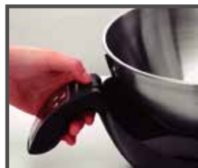
Tazón desmontable para facilitar su limpieza