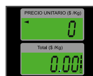
Pantallas de cuarzo con iluminación (backlight)