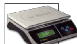
Incluye mica protectora